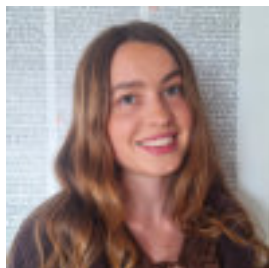
Natalie Diga © privat